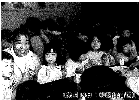
(先月14日 和納保育園)