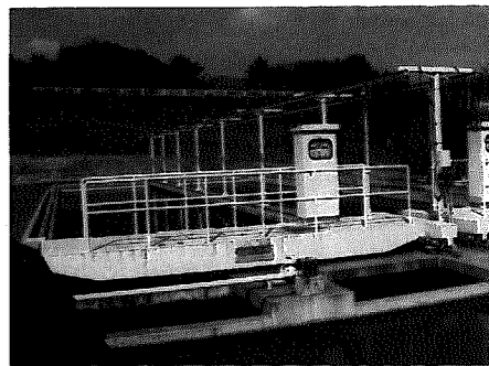
▲浄水場内にある沈澱池