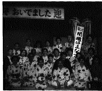
▲間瀬はまなす会のメンバー

終戦から五十一年目でやっと夢かない、疎開の地「岩室」へ。第二のふる里と思い、生きている内にといつも心にきめていました。緑の町並みを歩き、懐かしく思