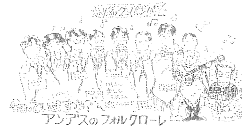
アンデスのフォルクローレ