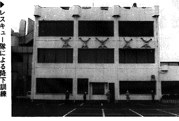
▶レスキュー隊による降下訓練

参加された皆さん、本当にご苦労さまでした。これからも、村の安全のためにがんばってください。