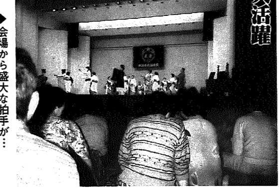
▶会場から盛大な拍手が...

岩小の五年生が、温泉病院で交流会。「入院患者の皆さん、早く元気になってください!」先月13日、岩室小学校の五年生児童が岩室温泉病院を訪れ、入院患者さんたちと交流会を行いました。