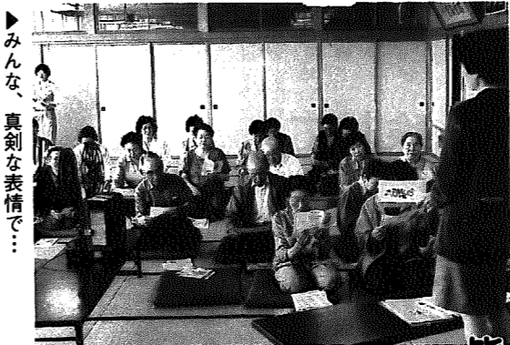
▶みんな、真剣な表情で...