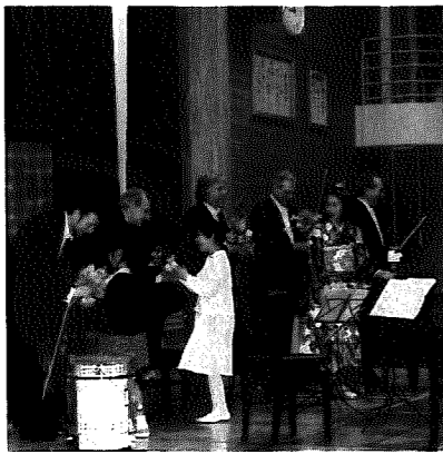
▲国際化の時代を迎え、交流を通して質の高い文化にふれあおう！

当村でも、21世紀に向けて創造的で活力ある社会を築いていく児童生徒の育成を目指し平成元年以来、和納小学校、岩室小学校の改築、間瀬小学校、岩室小学校の統合等教育条件の整備に取り組んできました。本年度は岩室中学校に重点を