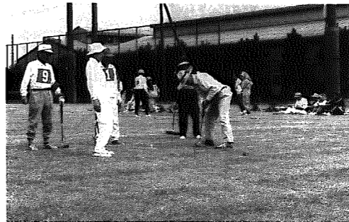
▲高齢化社会を迎え豊かに生きよう！

高齢者の福祉対策については可能な限り住み慣れた家庭や地域のなかで、安心して暮らし続けることができるようホームヘルプサービス事業、老人短期入所事業、デイサービス運営事業等、在宅福祉サービスを一層充実していきます。