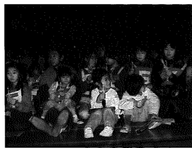
▲昨年のクリスマス大集会から