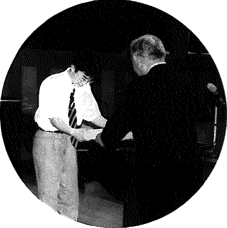
▲久しぶりに集う懐しい友の顔……