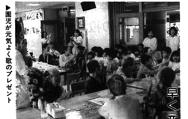
▶園児が元気よく歌のプレゼント

今回の参加した人たちは皆、各地区の区長さんの推薦を受けており、講師の話や聴く受講生の目は真剣そのものでした。