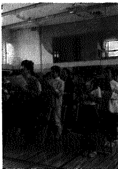
▶全校児童が総出で…