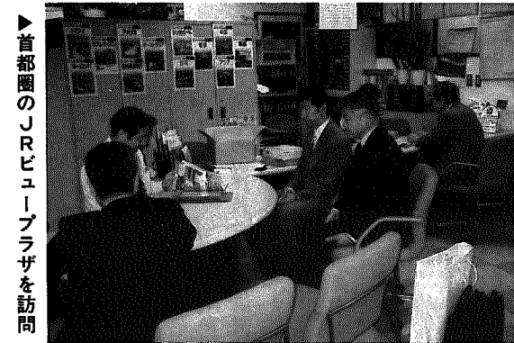
▶首都圏のJRビュープラザを訪問

観光キャラバン隊 ことしも首都圏へ 岩室村観光協会では、ことしも観光地「いわむろ」を、東京近郊の人たちにもっとよく知ってもらおうと、先月十三・十四日の両日、「岩室村観光キャラバン（旅行エージェンツ訪問）」を行いました。 当日は、観光協会関係者ら約十名が観光パンフレットや岩室せんべいなどを持って首都圏の「JRビュープラザ」を訪ねました。また、十四日には、千葉県の千葉駅など主要駅の前でポケットティッシュを配りながら、岩室に「よりなれ」と呼びかけました。