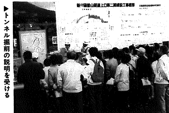
▶トンネル掘削の説明を受ける