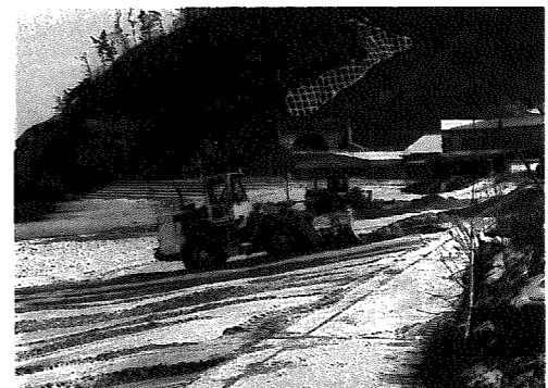
▲4月27日には、浜茶屋組合の皆さんに加えて、役場の重機も参加して「浜清掃」が行われた。