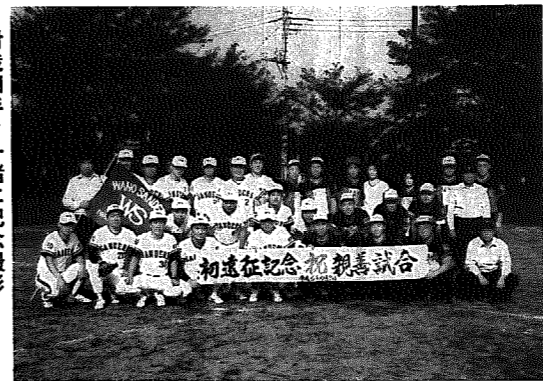
▶対戦相手と一緒に記念撮影