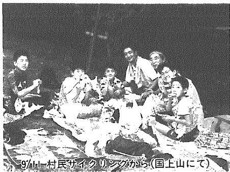
9/14 村民サイクリングから(国上山にて)