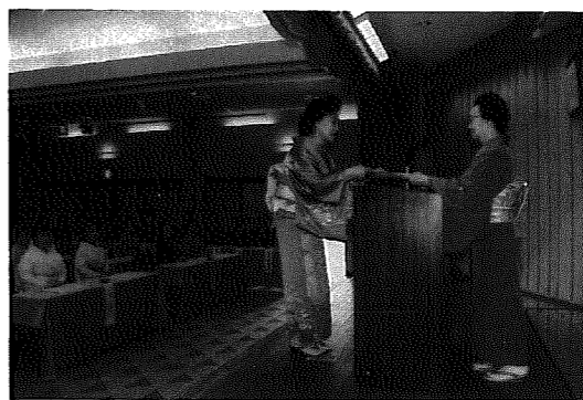
▶表彰を受け、決意も新たに...

この表彰式は毎年行われているもので、当日は永年勤続者(三年、五年、七年、十年)として十一名が、また努力賞として、長唄部門十三名・踊り部門十名がそれぞれ表彰されました。 いつもにこやかな笑顔で接客をしている芸妓さんたちの表情も、この日はなお一層晴れやかでした。