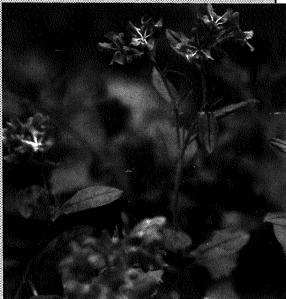
ホタルカズラ (ムラサキ科) Lithospermum zollingeri

さわやかな風と野山の緑がとても心地よい季節となりましたね。そこで今月の「おらが村の山野草」シリーズの第38回目は、深緑の野山でひときわ目を引く「ホタルカズラ(ムラサキ科)。をご紹介します。