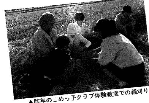
▲昨年のこめっ子クラブ体験教室での稲刈り

「いわむろ農業を考える会」では、今年も村内の子どもたちから自然に親しみながら、親子のふれあいを深めてもらうと「こめっ子クラブ体験教室」を下記により開催します。ぜひ皆さんも、親子揃って参加してみませんか。