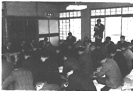
▲先月15日に開催された推進協議会

先月15日(火)、水田農業活性化対策推進協議会が開催され、出席した各地区農家組合長や農業関係者らに平成6年度の転作等目標面積(149.14ha)のうち一般転作137.59ha、他用途利用米11.55ha、前年比75.84%減)や限度数量などについての説明が行われました。 そして、ことしの転作推進についての村基本方針や稲作経営者への支援体制などの説明が行われ、平成6年度転作目標の達成及び限度数量適正集荷に向けての協力、要請が行われました。 明るい農業振興を目指すには、農家の皆さんの力が不可欠です。今年も皆さんのご理解と協力をお願いします。