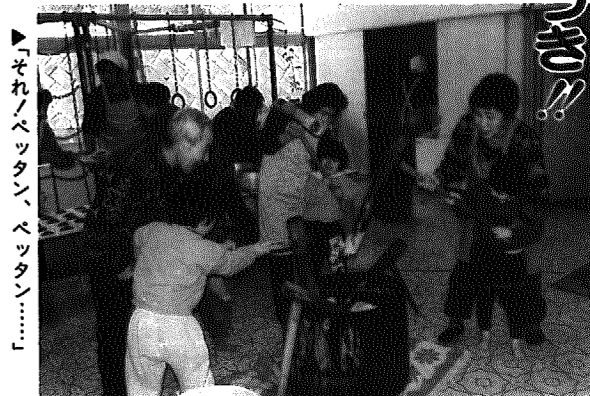
▶それ!ベッタン、ベッタン…!

おじいちゃんとおもちゃごき 「ベッタン、ベッタン」と、リズミカルな音が聞こえてきます。実はこれ、もちをついている音なんです。先月十五日、間瀬保育園で「おもちつき大会」が開かれました。 皆さん、写真を見て杵がちよつと小さいと思いませんか?でもこの杵、別の子供用というわけではないんです。間瀬地区では、五人くらいが一組になり、各々がこの小さな杵を持ってつくります。途中、水をつけずにつくため、できあがったおもちはおぼりけが強く「とつてもおいしい!」