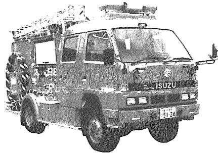
■近隣町村への出動状況 ■村内出動状況