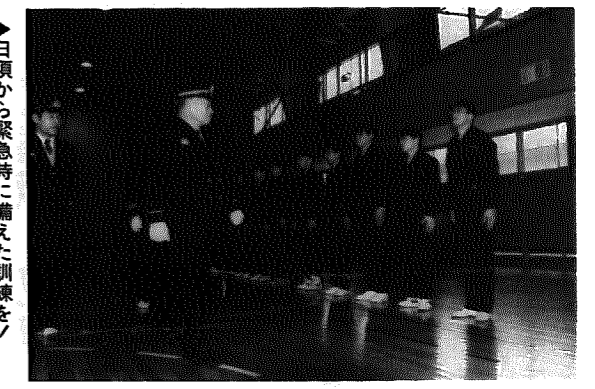
▶日頃から緊急時に備えた訓練を!

「岩室村消防出初式」 新春恒例の消防出初式が先月9日、村民体育館において行われました。当日は、村長をはじめ、村内5分団の消防団員や消防署員、消防関係者ら約200人が参加し、ことし1年の無火災・無災害を誓い合いました。 式典では、消防団員への辞令交付が行われた後、永年消防活動に尽力された団員に県知事及び消防協会から表彰状が贈られました。 参加者たちは皆一様に「火災のない住みよい村にしよう」と決意を新たにしていました。