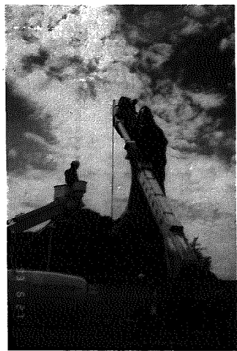
▲高所作業車も出動！

★日時…8月31日(火)まで ★観覧料…通常の入館料で観覧できます。 ※詳しくは、県立自然科学館(☎025-283-3331)へ。