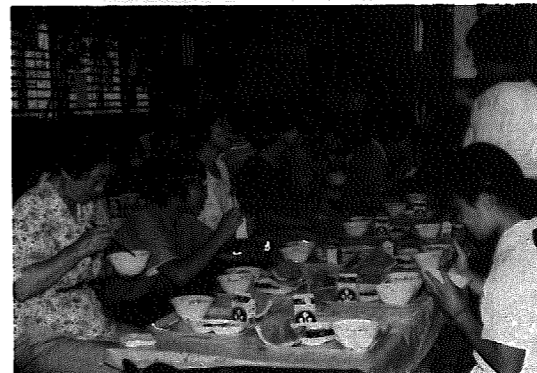
▶発表の後はお楽しみのランチタイム

また、参加者全員が体育館で揃って会食。普段と違い、お年寄りや両親と一緒に食べる給食は、「おいしい！」