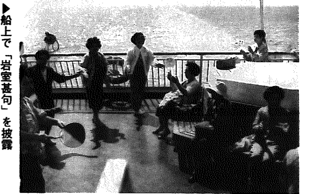
▶船上で「岩室甚句」を披露

と岩室甚句の交流会を行い、親睦を深めました。また、途中で自由行動の時間も設けられており、参加者は皆、思い思いの「佐渡」をゆっくりと味わいました。