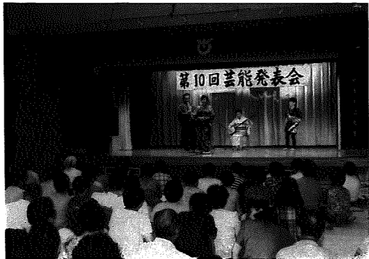
▶ことしも大勢の観客を集めて

当日は、この日を楽しみにしていた人たちが約二百人が会場に詰めかけ、発表が一曲終わるごとに、大きな拍手を送っていました。文化協会会長のあいさつの後、琴桂会の皆さんによる大正琴の調べで開幕。唄と踊りを交えた「岩室音頭」や「江差おけさ」のほか、詩吟やダンスそしてカラオケと、バラエティに富んだ発表に、出演者も観客も楽しいひとときを過ごしました。