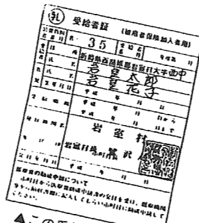
▲この受給者証をお持ちの方が、今回の対象者です

【乳児医療受給者証切替え手続日程】 ■日時●7月23日(金)受付(午後3時～3時10分)説明(午後3時15分～) ●7月26日(月)受付(午後1時～1時10分)説明(午後1時15分～) 両日とも会場は役場保健センターです。 ■対象者…平成4年8月1日以降に生まれた乳児。■持参するもの…①印かん ②保険証 ③母子手帳 ④通帳 保護者(父親)名義 ※問い合わせ及び詳しくは、役場保健衛生課(☎82-4111)までどうぞ。