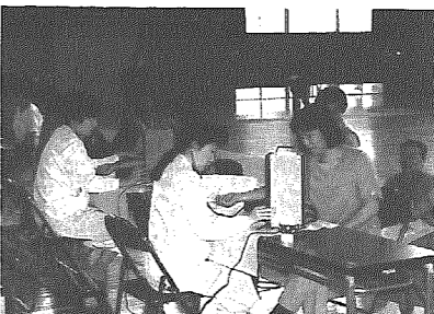
▲ことしの総合検診会場から

たり、バランスのとれた食生活に気をつけましょう。そして、腹式呼吸による深く、ゆっくりとした呼吸ができるように練習し(自律