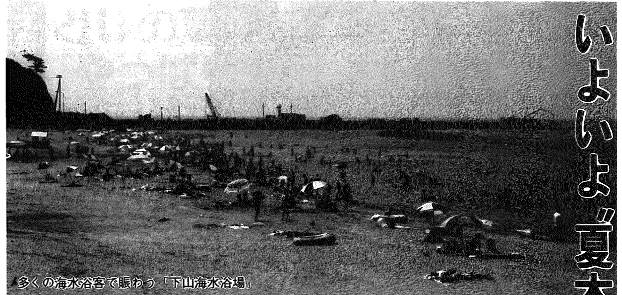
多くの海水浴客で賑わう「下山海水浴場」

きょうから七月、いよいよ夏本番を迎えます。いわゆる夏の楽しみは何も「まつり」だけではありません。いわゆる夏の忘れてはならないのが、そう「間瀬海岸」です。