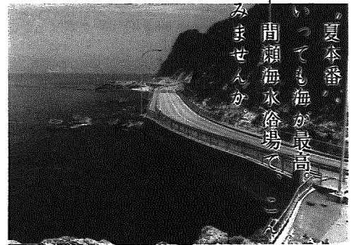
▲ドラマチックロード・越後七浦シーサイドライン

夏といえば、なんといっても「暑い日ざしと青い海」がよくお似合いですよね。間瀬海岸には、ドラマチックロード・越後七浦シーサイドラインに沿って、下山・田ノ浦の二つの指定海水浴場があります。どちらの海水浴場とも、夏の盛りになりますと、親子連れやカップルなど、レジャー客でいっぱいになります。