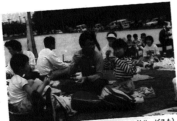
▲歩いた後は、お楽しみのランチタイム(とん汁サービスも)