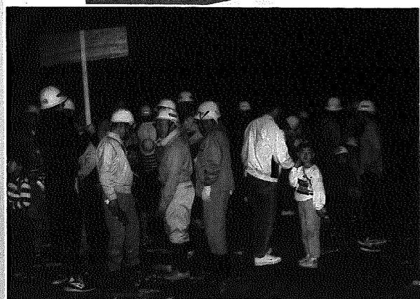
▲矢川放水路トンネル内を探検