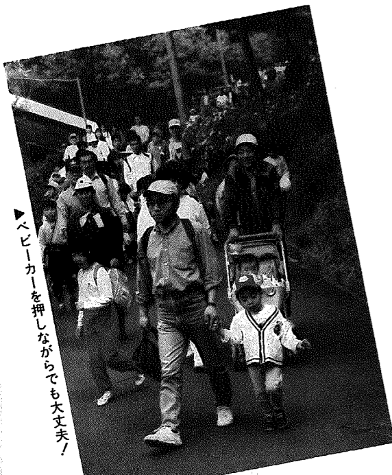
▶ベビーカーを押しながらでも大丈夫!