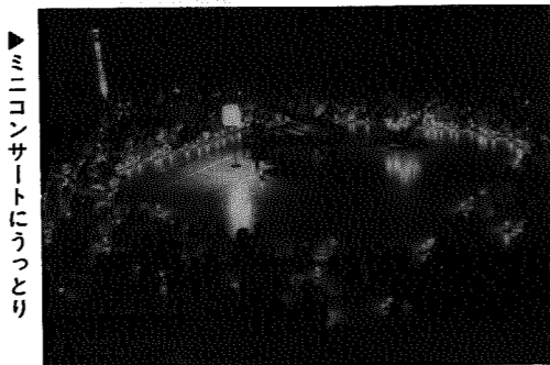
▶ミニコンサートにうっとり

“ゲーム・レクを通して親子のふれあいを深めるとともに、地域間交流を図ろう”と先月12日、村民体育館に於いて「第6回クリスマス大集会」が開催されました。当日は村内小学生の親子ら約550人が参加。キャンドルサービスやミニコンサートが行われると、会場内はすでにクリスマス気分一色。その後、ゲームやレクリエーションを親子で楽しみました。そしてサンタからのプレゼントもあり、参加者は楽しいひとときを過ごしました。