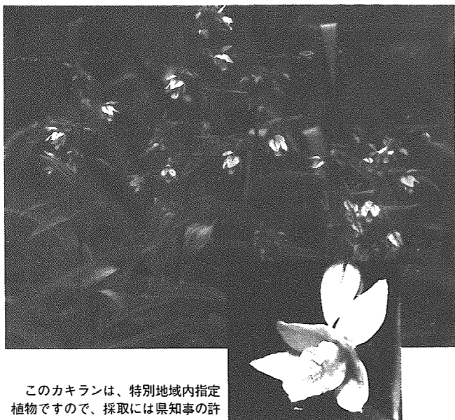
このカキランは、特別地域内指定植物ですので、採取には県知事の許可が必要です。(花期6月～7月)

今回ご紹介するカキラン(写真)は、この季節(初夏)に日当たりの良い湿地に多くみられる多年草の一種です。花は、茎の先に数個つき、花色は黄色を主として赤い色がまじり、柿の色に似ていることからこの名前がついたといわれています。葉は、細長い楕円形で、長さ5～15cmのものが5～10枚つき、茎の高さは30～60cmほどにもなります。