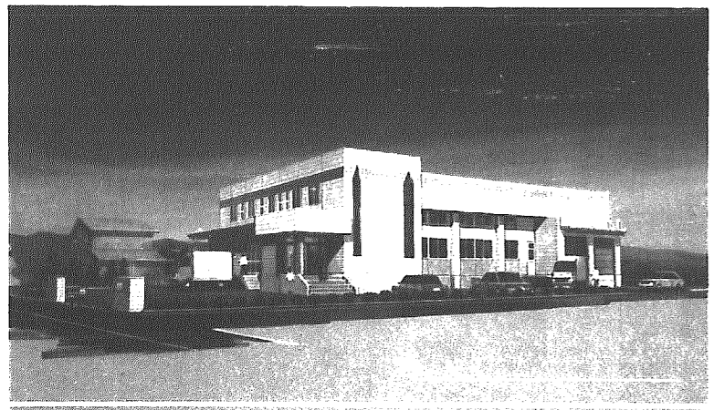
▲学校給食センター完成予想図

給食能力は一日千五百食(現在約千二百五十食)と今後の生徒(児童)数の増にも十分対応する能力をもつ施設で、今年度二学期から村内各小・中学校(間小除く)への給食を開始します。 ■学校給食センター工事 入札結果 ■建設工事 ・契約金額 1億2,055千円 ・契約先 ㈱水倉組 ■機械設備工事 ・契約金額 78,486千円 ・契約先 研冷工業㈱ ■電気設備工事 ・契約金額 21,367千円 ・契約先 朝日電業㈱