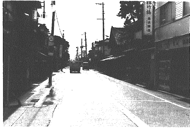
ドッシリと落ち着きを感じさせる和納4区の街並み

和納四区は、和納全体からみると、ほぼ中心に位置し、区域は、和納農協から巻町方面へ150m。県道をはさんで東西が範囲で、通称「中町」と呼ばれています。人口二三五人、世帯数六三戸、で自治会としては中規模でしょうか。家並みに、最も和納らしき、を今にとどめている、新旧混在する地区でもあります。