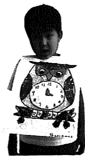
おおいわかんとくん (5歳児・和納第二保育園)