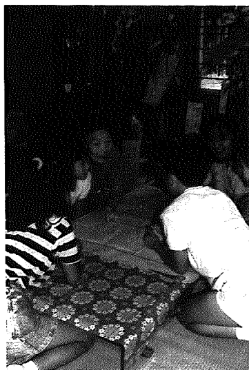
間瀬小「祖父母・孫ふれあいの会」

越後七浦有料道路が先月21日から一般開放(無料化)されましたが、それに先がけた記念イベント「日本海夕日ラインサマーフェスティバル」が、先月17日間瀬田の浦海岸で開催されました。このイベントは、一般開放を記念するとともに、日本海夕日ラインの美しい景観を広く観光客や県民にPRしようと開かれたもので、当日は県警音楽隊の軽快なマーチと勇壮な分水太鼓をオーブニングに、歌あり踊りありのアトラクションが続々登場。そして、来場者全員による「生きのこり大クイズ大会」では、めでたく勝ち残った人に豪華福袋のプレゼントがあったりと楽しさ満点。ほんとうにこの日は、美しい夕景とお祭り気分をたっぷり満喫していました。