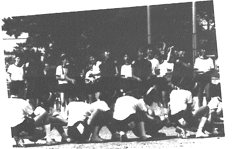
応援合戦もことは見もののひとつでした

熱い戦いに一喜一憂 「それ行け、ガンバレ」と大声援が飛びかかった岩室中学校体育祭。先月十日、雨空を吹き飛ばし元気に 行われました。この日は、待ちに待った体育祭とあつ て生徒たちは朝から元気一杯。心配された天候も生徒 たちの熱い戦いに押されっぱなし。百メートル走、 それに岩中名物?応援団合戦に大熱戦が繰り広げられ、 詰め掛けた観衆からも大声援が送られていました。