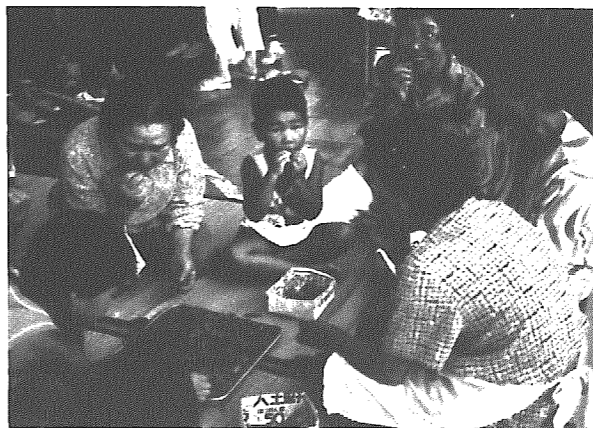
おばあちゃんたちと食べる枝豆はどんな味かな？

畑となる用地も、地元の人からの好意で転作田の一部を借りることが決まり、さつそく苗の準備にとりかかりました。そして、五月二十五日青空の下、待ちに待った苗植えの日、二十cm程に伸びた苗を老人クラブの人たちの指導で、園児たちが一本一本でいねいに植え付けました。参加した園児たち、カボチャの苗植えなどはじめての経験とあってウキウキソワソワ。しかし、老人クラブの人たちにとっては手慣れた作業とあってその指導も手とり足とり、みるみるうちに植え終わりました。こうして植え付けられた苗も天候に恵まれ、それに老人クラブの人たちと園児たちの親身な手入れですくすく育ちました。そんな期待を込めて育てた「わなみパンキン」。八月