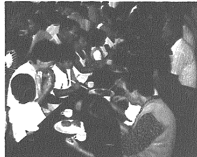
ボクも持てたジャンボカボチャ(写真上)自分たちで育てたカボチャ料理に大満足(写真下)

二十五日、待ちわびた園児と老人クラブの人たちの手で収穫されました。当日は、はじめてみるジャンボカボチャやおもちやカボチャに園児たちも大喜び。「二人で持てるかなあ」「こんなに小さいの」なんて声も聞かれた「ふれあい農園」。カボチャと一緒に世代を超えたふれあい交流も大きく実りました。