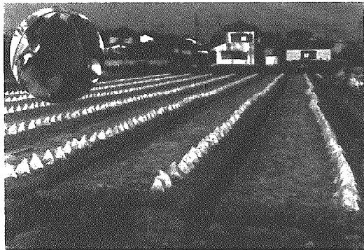
転作田に植え付けされたカボチャ苗

食生活を見てみると、いままでの米主食型から少しずつその体型が変化してきています。そのため国民一人当たりの年間米消費量が減り、余剰米が問題となりはじめ米の生産調整が行われました。米の在庫とその