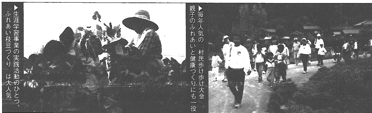
▶ 生涯学習事業の実践活動のひとつ、ふれあい枝豆づくりは大人気