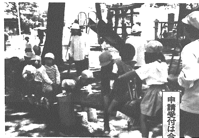
申請受付は今日17日～20日

税(村民税・固定資産税)の納税証明書。ただし、岩室村に本社・支社・営業所がない場合は、法人税所得税 ⑩経営事項審査申請書の写し(土木事務所へ提出し、審査を受けた提出済印のあるもの) ⑪建設業退職金共済組合加入証明書 ⑫物品：物品入札・見積りも参加資格審査申請書 ⑬経歴書 ⑭法人登記簿謄本(写し) ⑮営業所一覽表 ⑯直前一年分の決算書 ⑰岩室村の村税(村民税・固定資産税)の納税証明書。ただし、岩室村に本社・支社・営業所がない場合は、法人税所得税 ⑰販売代理店(特約店であることを証する書面) 【申請期間・提出先】：二月一日から二月末日までに、役場総務課財政係(☎82-4111内線201)へ。