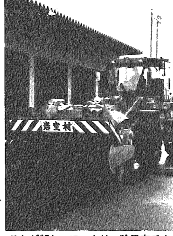
これが新しいロータリー除雪車です

村では、ことしの大雪に備え、新しくロータリー除雪車(九トン級)を購入しました。これで村の除雪車は全部で五台。これからは今まで以上のスピードで除雪作業ができると期待しています。ところで、ロータリー除雪車はみなさんご存じのとおり、雪を巻き込みながら除雪をします。少しくらいのものならなんでも巻き込んでしまえますのでとても危険です。それに運転が難しく、路上駐車や道路ぎわにものがあると除雪ができません。みなさんのご協力をお願いします。