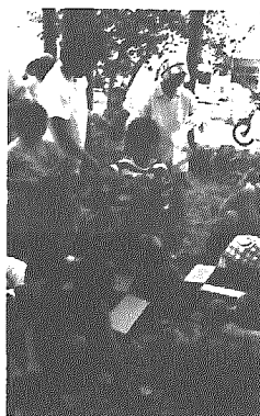
橋本神社境内での豆もぎ

おじいちゃんやおばあちゃんたちと力を合わせて豆をもぎました。畑に入って枝豆を思いきり引き抜きとっても楽しかったです。あとでゆであがった枝豆をみんなで食べたり、ほくたちのピアノ演奏も聞いてもらってとてもよかったよ。