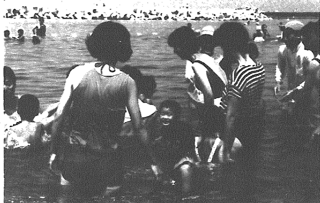
海水浴には絶好のコンディションに恵まれ大喜びの参加者

夏真っ盛りの先月七日、間瀬地区公民館前の海岸で親子水泳教室が開かれました。これは今回初めて開かれたもので、約五十組、百人の親子が参加。水とのふれあいを楽しみました。指導は日本水泳連盟第二種水泳指導員の十人の先生たち。きちんとした初心者用の水泳指導教本にそっての指導は、まず水に慣れることからスタート。遠浅で波のない絶好の海水浴コンディションにチビツ子や親も大喜び。保育園児以下の子供たちと小学生以上の子供たちの二班に分かれ、体を浮かせたり、水に潜ったりの基本水泳から浮きわを使った水泳リレーなどのレクリエーションも楽しみました。ところで水泳教室というとプール——という感じが強いのですが、海水浴を兼ねた海での教室に参加者は大満足。おまけに、親子のふれあいの十分はかるとあって好評。教室のしめくくりは、婦人指導員がこれまた海では初めてというシンクロナイズド・スイミングの演技を披露、親子水泳教室に花を添えました。