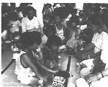
とれたての枝豆を食べながら交歓

大勢の人たちと何かをやるってことは、本当にすばらしいことですね。今回の園児たちとの枝豆づくりは、作る楽しさ、収穫する喜び、そして子供たちとの世代を超えた交流——といったことづくめで楽しい思い出ができました。いま思い出しても、枝豆が実るまでには、その出来が大変気になり、畑を通るたびに「どんな具合かな」とながめたりして……。それもまた楽しいことでした。