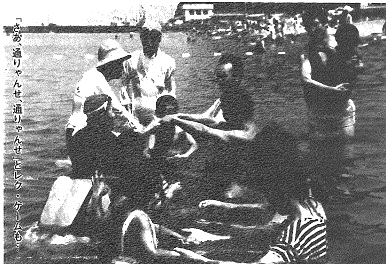
「さあ、通しゃんせ、通しゃんせ」とレク。ゲームも。