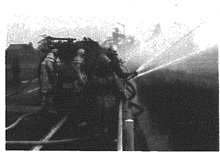
消火・救助活動を行う消防定期総合演習

今月十九日(日)午前八時三十分から岩室村消防定期総合演習が和納小学校グラウンドをメイン会場に行われます。これは防火活動の円滑化と、状況に応じた防災訓練などを実施して、防火に対する理解と意識の高揚を図るために行います。当日は、ポンプ操法競技や部隊訓練、分列行進などのほか火災を想定した消火、救急救助活動などの仮装演習を和納八幡神社うらの西川堤防で予定しています。ところで演習日の十九日には朝七時半に演習招集信号として各地区の消防防災無線施設を使ってサイレンを鳴らしますので、ご協力をお願いします。