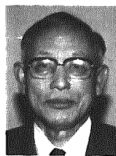
村教育委員に村教育委員 村教育委員 村教育委員