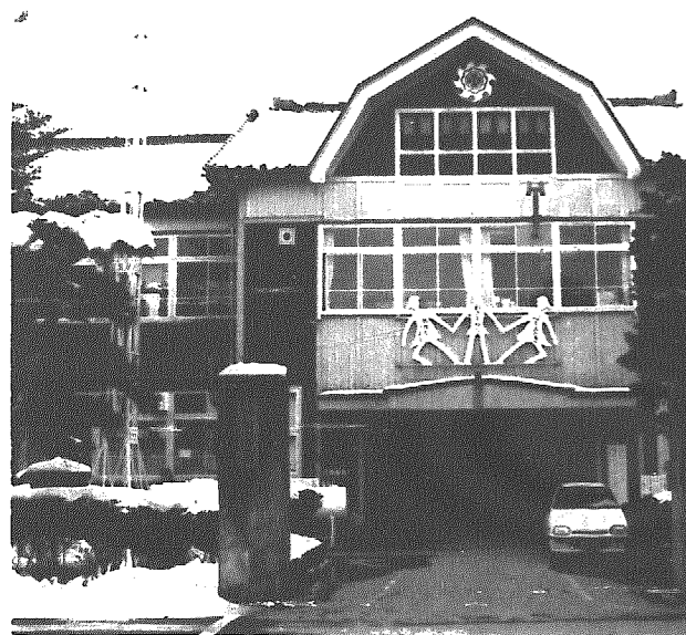
移転改築が決まった和納小学校(現校舎)

使用できるうえ、工事に伴う騒音問題(子供たちや近隣民家など)への配慮や工事中の方が一の子供たちの事故防止が図れる③交通が至便である④二万七千平方(二町二反歩)のまとまった土地が地権者のみなさんの積極的な協力で確保できること、総合的な計画立案が可能になる(校舎の配置など)⑤移転に伴う現在地の有効利用も含めた将来の地域開発など展望が大幅に広がるなど)がそろっている点で、現在地よりも適正な場所であると答申されました。これにより事業計画はグッと具体化し、六十四年度から二か年事業で建設をすすめる布石ができました