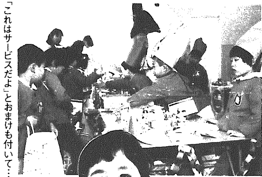
「これはサービスだよ」とおまけも付いて...