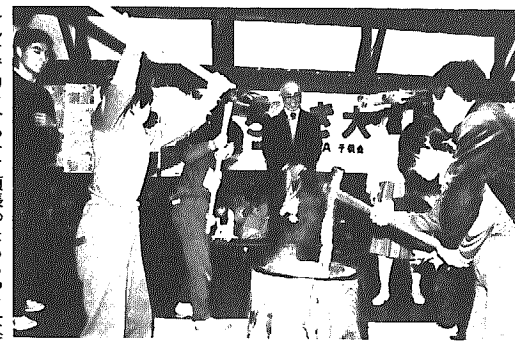
みんなで力を合わせて頑張ったもちつき大会