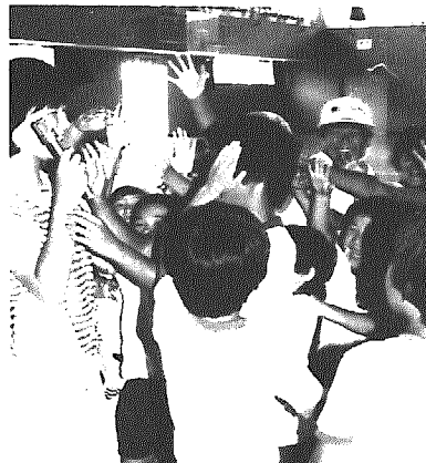
あなたもすばらしい出合いを求めて

自分の特技や能力を生かせる場を、と考えている人は多いはず……。一方で、クラブは結成したものの会員不足で悩んでいる団体がある……。両者をうまく結びつけることができれば一石二鳥。そこで、今月は昭和六十三年度の会員募集をしている村文化協会・体育協会の各クラブをご紹介しますので、四月から新たな「いい仲間」を求めて、みなさんもぜひ参加しませんか。きつと生活に張りげができ、新たな出会いとすばらしい感激を味わえるはずですよ。各クラブの申し込みは、今月二十三日までに岩室村公民館(☎82-14444)へどうぞ。もちろん開催日に直接申し込みでもOK。