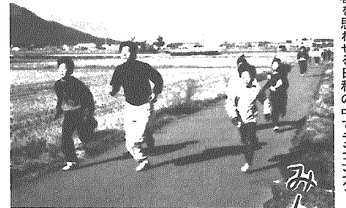
春を思わせる日和の中でランニング