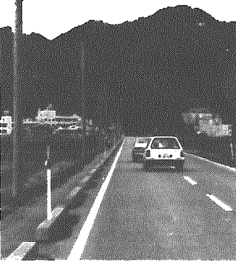
事業費四百万円で整備した街路灯(中央保育園付近で)

先月24日、岩室中学校や加治川中学校、豊浦中学校など県内の強豪チーム23校が参加して第3回新潟県中学校バレーボール選抜優勝大会女子の部が村民体育館と岩中体育館で開かれました。厳しい練習を積んできた選手たちは、日ごろの力を出しきろうとファイト満々。激しい攻防が一日中続いていました。