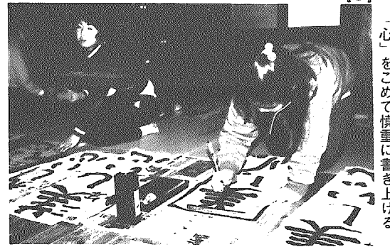
「心」をこめて慎重に書き上げる