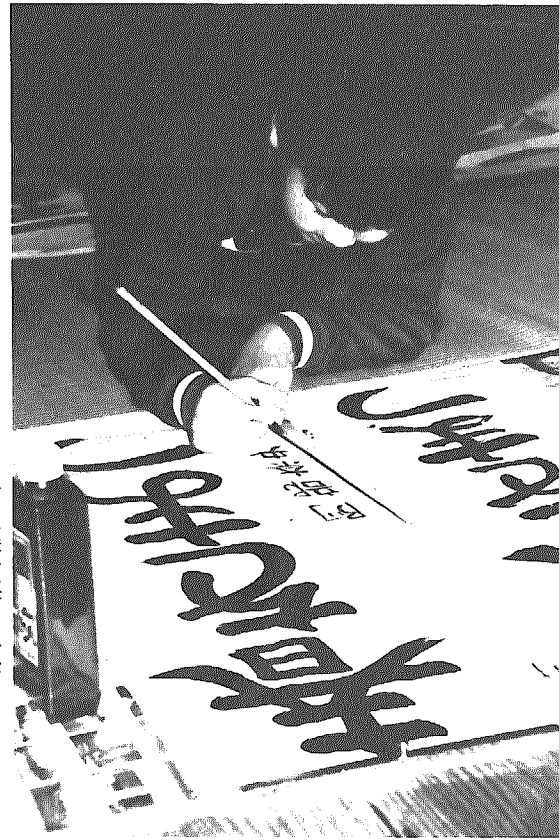
「ウーシ、なかなか力強い字だね」—名前も慎重に書き入れて—

いまごろの時期になると本当にピッタリくるのが、この書き初めにある「春を待つ」。ことしは二年続きの暖冬で、いままでのところ雪模様の日が数日だけ。そんななか先月13日、間瀬小学校で新春恒例の書き初め大会を行いました。屋内運動場の床にゴザを敷いて「春をまつ」「美しい心」「友情団結」など各学年ごとに指定された文字を書きました。「え〜と、ここは力を入れて…」と、手本を見ながら自己評価。「ちよっと曲がったかな」と言いながらも力強い作品が次々にできあがりました。