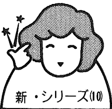
新・シリーズ(10) 文責/保健婦