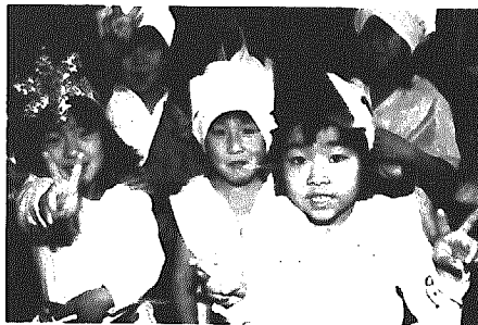
(今日は62年11月21日から12月20日まで)に届出を済まされたものです。

●歯の健康は、体の健康を支える第一歩です みなさんは何分くらい歯をみがきますか?よく「三分磨く」といいますが、三分磨けばきれいになるのではなく、あなたにあった磨き方で一本ずつ、でいねいに磨くことが大切で、その結果三分以上かかることもありますし、もつと短い時間でも十分なものもあります。 今までの習慣を変えるのですから、とても大変なことですが食事をするのは体のため、歯を磨くのは歯の健康、そしてやはり体を維持していくためにとても大切なことです。 みなさん、どうですか、思いきって歯磨きの習慣をかえてみませんか。歯の健康は体の健康づくりの第一歩です。