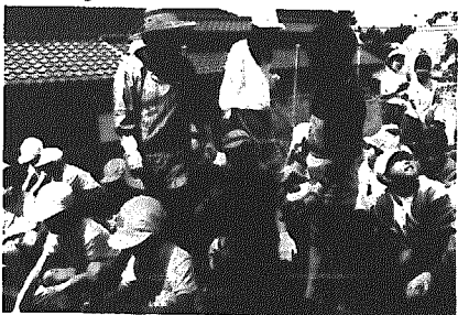
(今月は62年4月21日から5月20日まで)に届出を済ませられたものです。