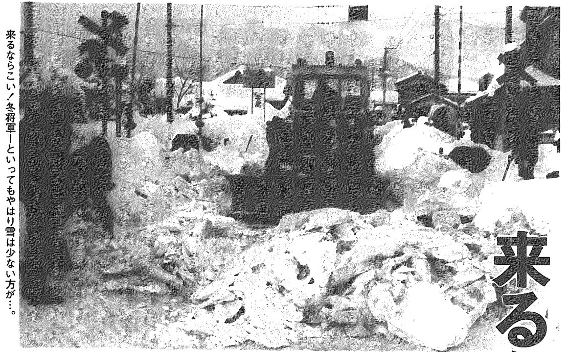
来るならこいノ冬将軍—といってもやはり雪は少ない方が……。

道路ぎわのへいや垣根などが雪に埋っていると、除雪車が壊してしまうことがあります。危険な場所には、竹ざおに赤布で目印を立てておいてください。