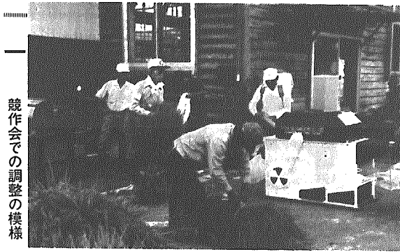
競作会での調整の様

今年のコシヒカリの収量を競う、「うまい米づくり推進競作会」が先月18日、東体育館(旧役場脇体育館)で行われました。今年、「7月の天候不順で出穂が平年に比べ1週間近く遅れたため、作柄に不安があったが…」といわれるなか、農家のみなさんの高度な栽培技術で大豊作といわれた昨年に次ぎ豊作の年となりました。今回の出品点数は過去最高の129点を数え、最高収量は700kg(昨年は782kg)。10アール当たりの平均収量は595kg(昨年は625kg)でした。上位入賞者の成績をご紹介します。