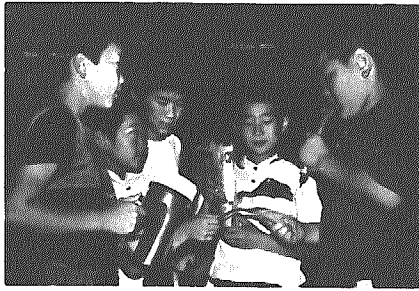
(今月は61年6月21日から7月20日まで)に届出を済ませられたものです。