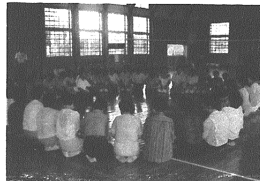
ミニバレーボールの説明では、みんな輪になって…(東体育館で)

教室最後のメニューはレクダンス。参加者全員、胸に名札を付け、まず顔と名前を覚えてもらおうという交流の機会をつくりました。