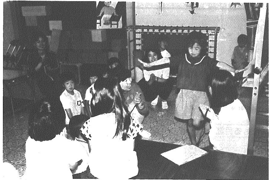
間瀬保育園での体力測定

新潟県公衆衛生看護学校の学生約四十人が、先月二日から四日までの三日間、間瀬にある自然休養村管理センター白岩で実習を兼ねた合宿を行いました。合宿中、地区民を対象に連日、衛生教育や乳幼児健診を実施しました。