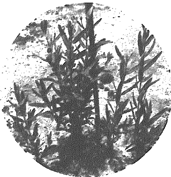
白い可憐な花が咲きます

村の天然記念物に指定(昭和48年2月26日)されているバシクルモン。間瀬が南限とされる野草で、ツボクサ(北限)とともに学問的にも注目されています。このバシクルモンが自然休養村管理センター前の花壇に移植してあります。ご覧ください。