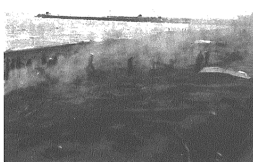
これで海岸もスッキリきれいに——

間瀬海岸をきれいにしようと、間瀬地区民が総出で、先月十三日、海水浴シーズン本番を前に越後七浦シーサイドライン沿いの海岸でクリーン作戦を展開しました。生活にかかわりの深い海岸をきれいに——と毎年の恒例行事となっているもので、各分団(一分団は七分団)から約三百人の地区民が参加、あいにくの雨模様でしたがスコップや熊手などの道具を使ってクリーン作戦を行いました。海から流れてきた木の枝や木片が多く、参加者は手ぎわよくそれらを拾い集め、所々に小さな山をつくり、完全に燃やして海岸をスッキリきれいにしました。