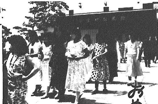
8月15日(金)(午前9時半受付) 岩室村公民館講堂で

この国民年金保険料の免除申請については、役場住民福祉課国民年金係(☎四一一一内線一一七)へお問い合わせを。