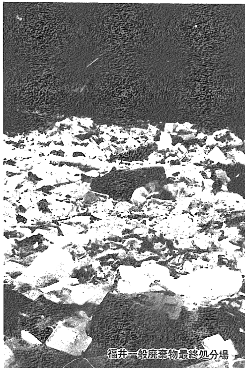
福井一般廃棄物最終処分場

わたしたちの家庭からは、毎日たく さんのゴミが出ます。岩室村全体では、 積みも積もって、現在一日に約八トンの 量になっていきます。そして、そのゴミ の処理費に約一億円もの費用がかか っています。増え続けるゴミと処理費 に対して、わたしたち一人ひとりが真 剣に考えなければならぬ状態になっ ています。