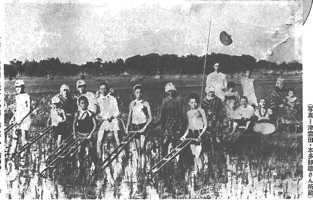
(写真)津雲田・本多静雄さん所蔵

一枚の古びた写真が明らかにする思いがけない歴史(記録)の一幕。みなさんの秘蔵写真を紙上公開します。お手元にあるとっておきの一枚を広報いわむろにお送りください。 ●応募先=〒953-01 岩室村大字西中660 岩室村役場 総務課 企画係 ☎82-4111 内線201・202