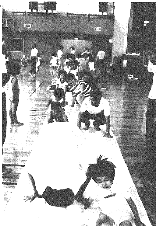
親子のふれあいも重要な学習(親子レクリエーション教室)