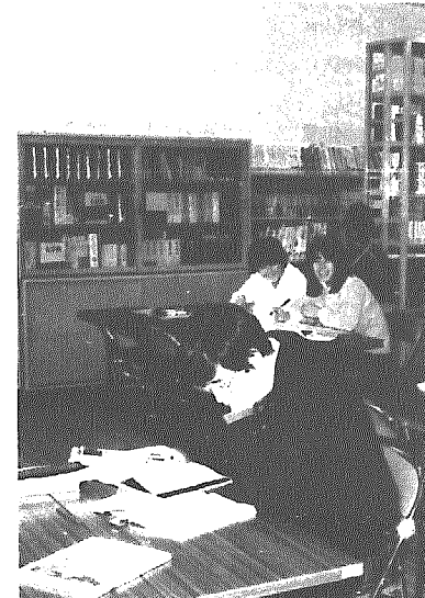
個人学習として図書室の利用も多い(公民館)

社会の要求―生涯学習 近年のめざましい科学技術の進歩や、 寿命の延長、さらに生活水準の向上や 自由時間の増大など社会の諸条件の変 化に伴い村民の「学習」に対する関心 は高まってきています。 例えば、村が開設している「親子セ ミナー」「青年ふれあい講座」「料理 教室」「婦人学級」「村民講座」「高 齢者学級」「子ども会指導者講座」な ど毎回盛況で、こんなところにも社会 全体が学習することを求めていること がうかがえます。今、社会が要求して いるものは、物質的な豊かさへの追求 から精神的な豊かさを求めるように変 わってきています。