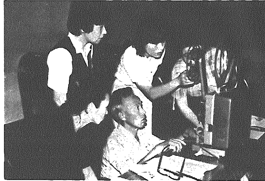
16歳映写機認定試験も好評(子ども会指導者専門講座)

進大会」を開催します。 地域に根ざした生涯教育の推進のた め、みなさんふるってご参加ください。 日程等は別掲のとおりです。 ■「学習」とは、みなさんの家 庭、職場、学校、地域社会など において、家庭生活や村民生活に関 することや仕事に関することを学 んだり、資格の取得、芸術、芸能 趣味に関することを習ったり、ス ポーツ活動を行ったりすることで、 方法も学級、講座への参加、グル ープによる活動や図書などによる 個人学習も含むもので、その形式 はさまざまです。