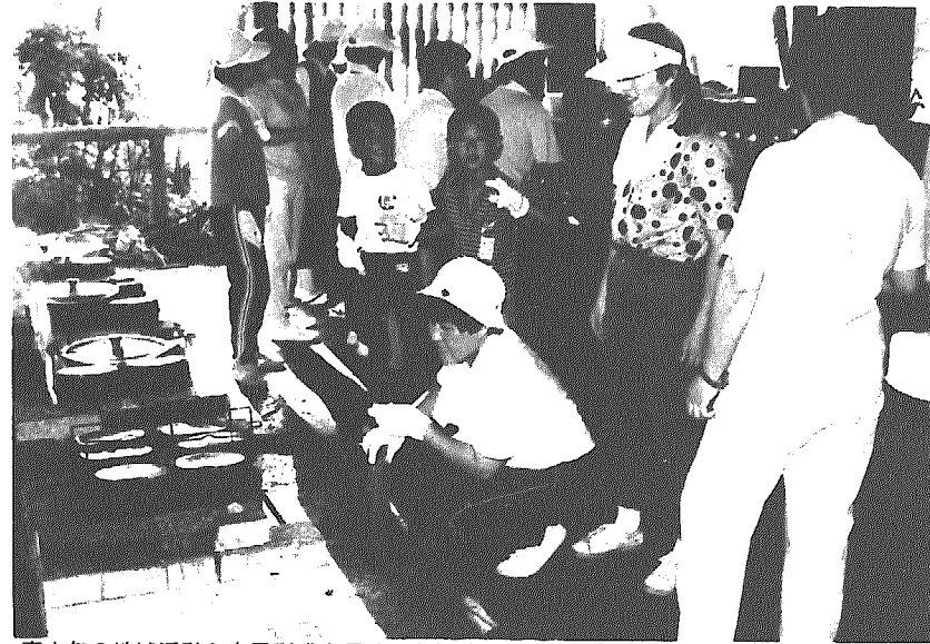
青少年の地域活動と自己形成を図ろうと体験学習が活発(地域子ども会・崖松キャンプ場)